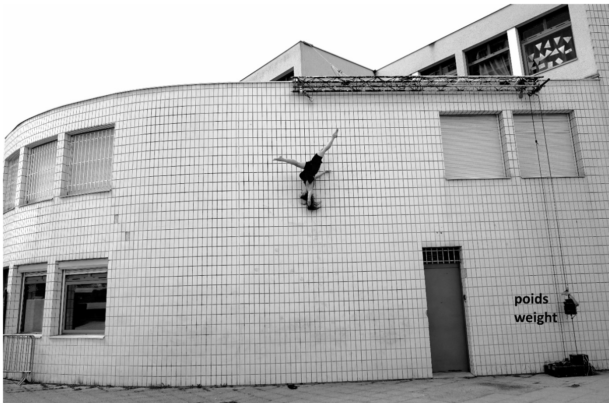
AD – Mante la jolie 2023