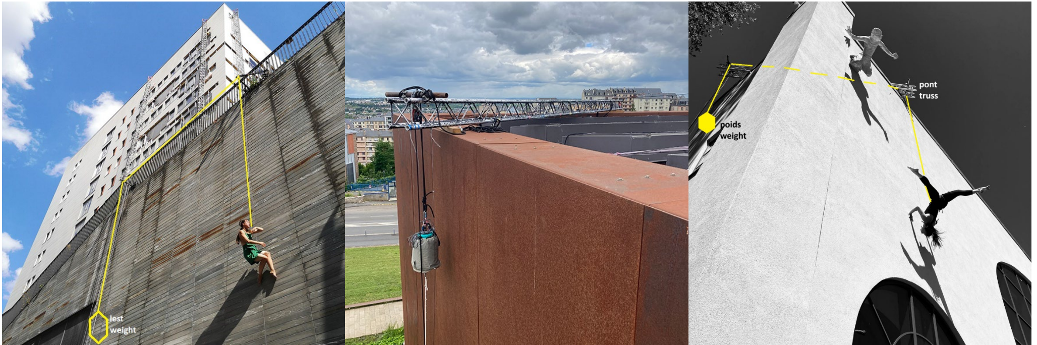
AD – 2R2C Paris 2023 – Musée Soulage Rodez 2024 – Chemnitz 2025