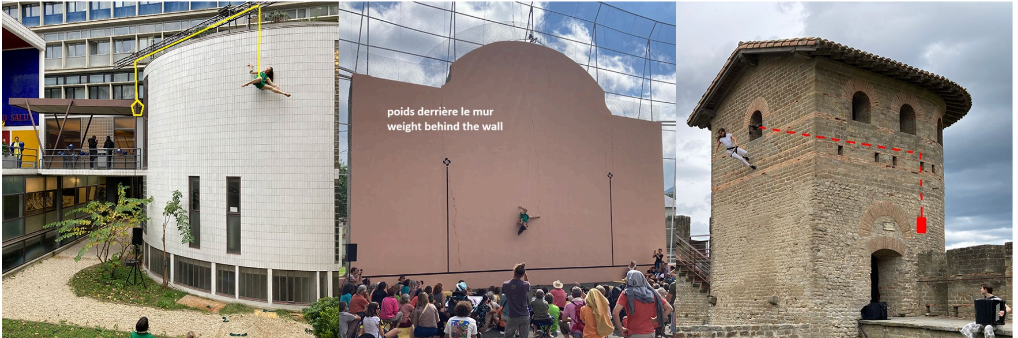
AD – Cité Refuge Paris 2024 – Bagnière de Bigorre 2024 – Cité de Carcassonne 2025.